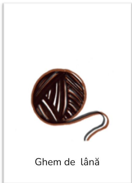
Ghem de lână