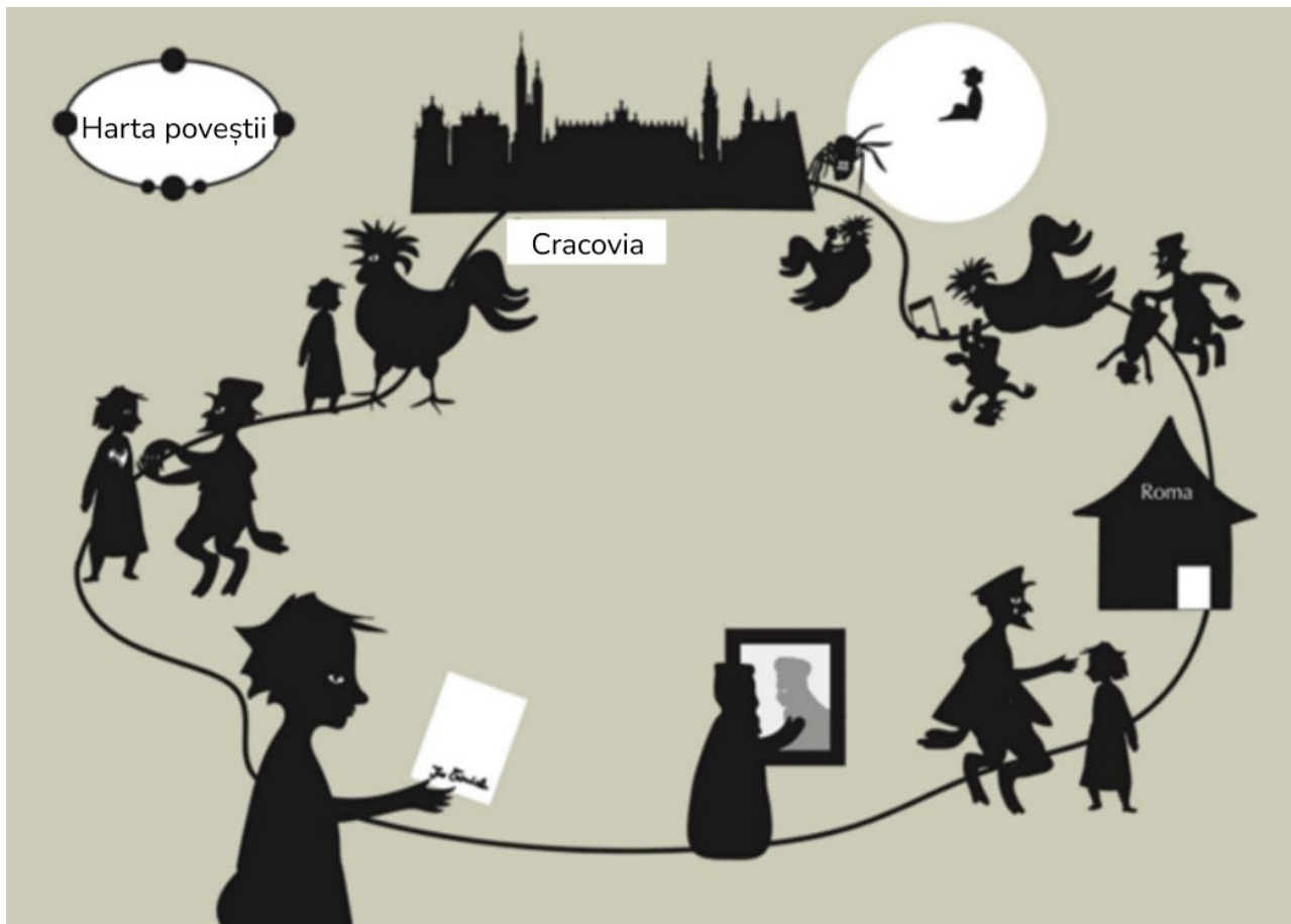
HARTA POVESTIRII “Cel mai puternic vrăjitor”

Harta se dovedește a fi atât un instrument valoros de sprijin vizual pentru narațiunea profesorului, care o poate folosi, de exemplu, în timp ce citește, făcând pauze și arătând diferitele etape/scenarii pe măsură ce avansează în povestire, sau poate fi folosită ca o bază de la care profesorul poate povesti oral pornind de la imaginile reprezentate.