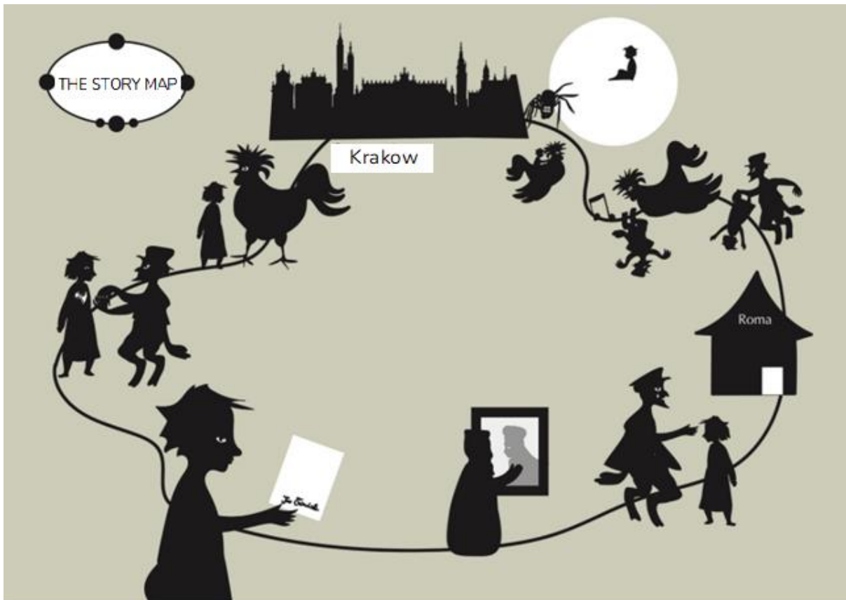
Ο ΧΑΡΤΗΣ ΤΗΣ ΙΣΤΟΡΙΑΣ «Ο ισχυρότερος μάγος»

Ο Χάρτης της Ιστορίας έχει διττή λειτουργία. Αφενός, προσφέρεται ως πολύτιμο οπτικό εργαλείο υποστήριξης της αφήγησης που κάνει ο/η εκπαιδευτικός, που μπορεί, για παράδειγμα, να τον χρησιμοποιήσει κατά την «online» ανάγνωση της ιστορίας, κάνοντας παύσεις και επισημαίνοντας τα διάφορα στάδια/σκηνές καθώς εκτυλίσσεται και εξελίσσεται η αφήγηση. Αφετέρου, μπορεί να χρησιμοποιηθεί και ως «βάση» από την οποία ο εκπαιδευτικός μπορεί να αφηγηθεί προφορικά την ιστορία αξιοποιώντας μόνο τις αναπαριστώμενες εικόνες.